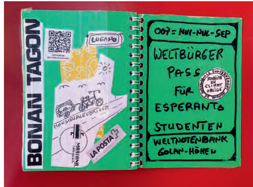
Der Weltbürgerpass von Parzival'